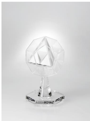
AQUA ROYAL® Energiestern Plus 32m „Comfort“

Für alle AQUA ROYAL® - Produkte gewähren wir ein 4-wöchiges Rückgaberecht.