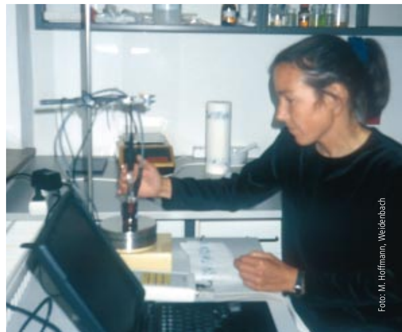
Abbildung 1: Elektrochemischer Arbeitsplatz

Zur Bestimmung elektrochemischer Parameter in Lebensmitteln entwickelte die Firma EQC (Elektrochemisches Qualitäts-Consulting, Weidenbach) einen praxiserfahrenen Screening-Test, der im Rahmen des Forschungsprojekts „Bundesprogramm Öko-Landbau“ an Möhren und Getreide validiert wurde ( BMVEL o. J. ). Da elektro-